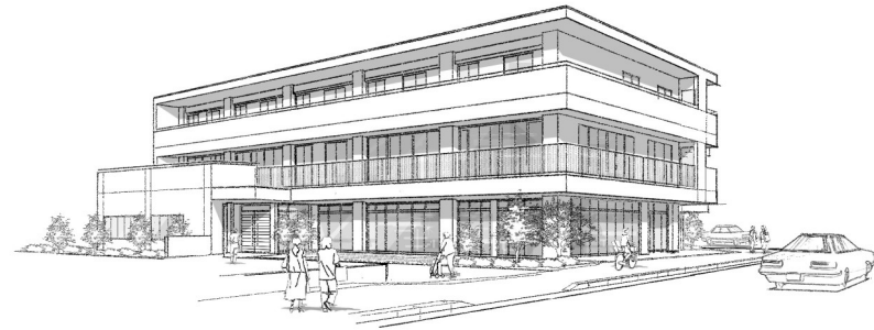
ほっと平針1丁目 外観イメージ