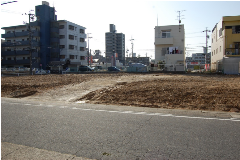
現況 更地の状態から夢が形作られます